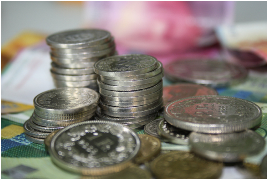
Geldsegen dank Mikrokredit zieht.

Die finanzielle Unterstützung des Vereins GO! für Unternehmer erfreut sich grosser Beliebtheit.